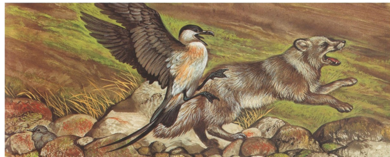
Lakroda me klabar da ato ok oc gu vanlanis ok vantatas kujdik kevrojor. Batitze naelaf inestol kranoveson bazalar. Voxen zveri va kixvuoc kev ayik diere exakkar , estobason drumo inafa taka, va in battode lassuqlekkur.