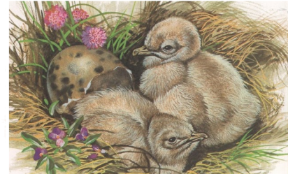
Arti ocaugual vas 23 viel, toluy lakrodok besanaf gu saya divatoad. Arti tanka ok tolka, va atoxo bilud ise art konake sanoye metre illanid, bravason valey crdada ok dzopoka. Ba kha vas 26 viel, parmon itlad.